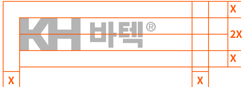
가로, 세로 간격규정

로고 적용 시 다른 그래픽 요소와의 간격은 세로 사이즈의 50% 이상이 되어야 합니다. 또한 가장자리와의 거리는 로고 세로 사이즈의 100% 이상이 되어야 합니다. 로고의 최소 크기는 25mm 혹은 100px로, 이보다 작은 크기로는 사용할 수 없습니다. (KH그룹 전사 동일적용)