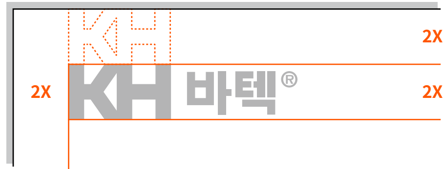
최소 사이즈 사용규정